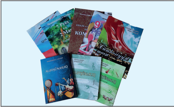
Məmmədəğa Umudovun çap olunmuş əsərləri