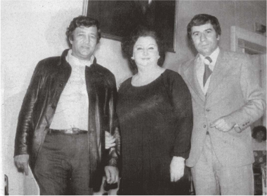
Arif Məlikov, Şövkət Ələkbərova, Ramiz Mirişli

yaradıcılıq əlaqəni saxlayır. Məşədi Əzizbəyov adına Azərbaycan Dram Teatrında Seyfəddin Dağlının "Kölgələr sürünür», «Qarabağ əfsanəsi», Gənc Tamaşaçılar Teatrında Əkrəm Əylislinin «Mənim nəğməkar bibim», İsi Məlikzadənin «Sağlıq olsun», I.Coşğunun «Ana laylası», «Kiçik tərə» tamaşalarına, Cəlil Məmədquluzadə adına Naxçıvan Dövlət Musiqili Dram Teatrında Hüseyn Cavidin «Ana», «Azər», Nazim Hikmətin «Bayramın birinci günü», Manaf Süleymanlının «Dəyirman», Kəmalə Ağayevanın «Mənim tanrım gözəllikdir, sevgidir» kimi bir çox tamaşalara musiqini Ramiz Mirişli yazmışdır.