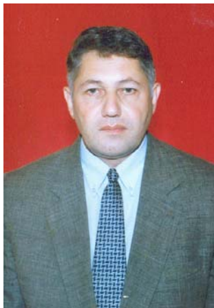
Azərbaycan Respublikasının əməkdar incəsənət xadimi, bəstəkar Nazim Quliyev

Musiqişünas Səyavuş Əlizadənin «Naxçıvan yallıları» elmi-tədqiqat işinin Muxtar Respublikanın musiqi həyatında ilk elmi əsər kimi diqqəti cəlb etməsi, Məmməd Ələkbərovun «Naxçıvan el mahnıları» toplusunun işıq üzü görməsi və hazırda bir sıra musiqiçilərin elmi-tədqiqat işləri üzərində çalışmaları Naxçıvan musiqi mədəniyyətində musiqişünaslığın inkişafından danışmağa imkan verir.