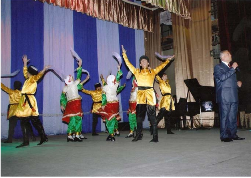
Naxçıvan Dövlət Filarmoniyasının «Araz» Dövlət Mahnu və Rəqs ansambli