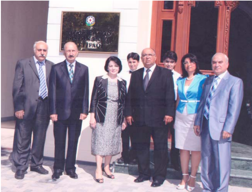
Azərbaycan Bəstəkarlar İttifaqının Sədri Firəngiz xanım Əlizadə İttifaqın kollektivi ilə birlikdə

O, bəstəkar üçün çox zəruri sayılan, bilavasitə Tofiq Bakıxanovun yaradıcılıq üslubunu səciyyələndirən bir keyfiyyəti xüsusi vurğuladı: «Elə bəstəkarlar var ki, mahnı janrından yuxarı qalxa, elələri də var ki, klassik janrlardan aşağı, yəni mahnı janrına enə bilmirlər. Tofiq Bakıxanov üçün belə problem yoxdur. O, musiqinin bütün janrlarında yazıb-yaratmışdır».