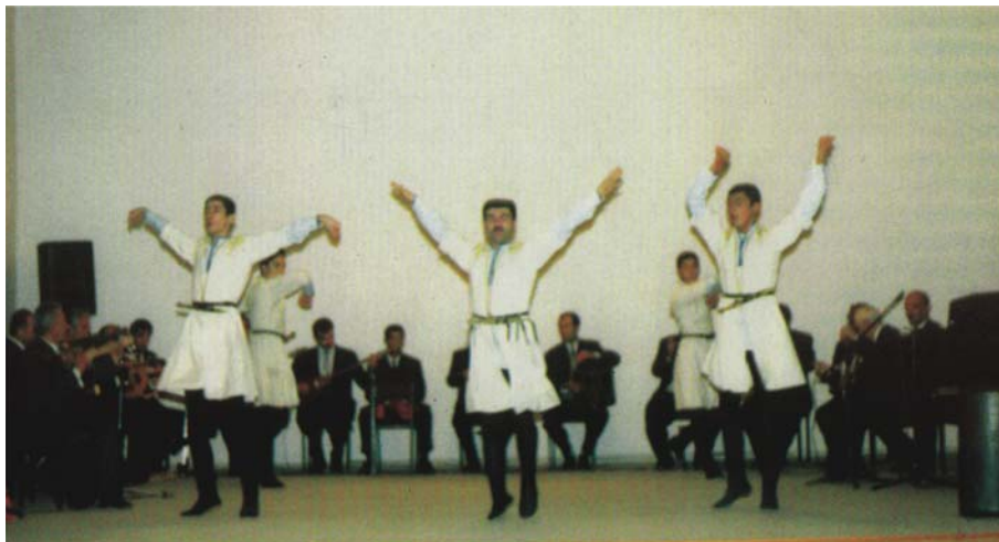
Naxçıvan Dövlət Filarmoniyasının «Mahnı və rəqs» ansamblı, 2002-ci il

«Musiqi və təsviri incəsənət» kafedrası, 1996-cı ildə həmin kafedranın bazası əsasında konservatoriya ixtisasları yaranır. Belə ki, Konservatoriyada fortepiano, skripka, musiqişünaslıq, bəstəkarlıq, xor-dirijorluğu, xalq çalğı alətləri, ifaçılıq ixtisasları açılır. 2000-ci ildən burada opera studiyası da fəaliyyət göstərir.