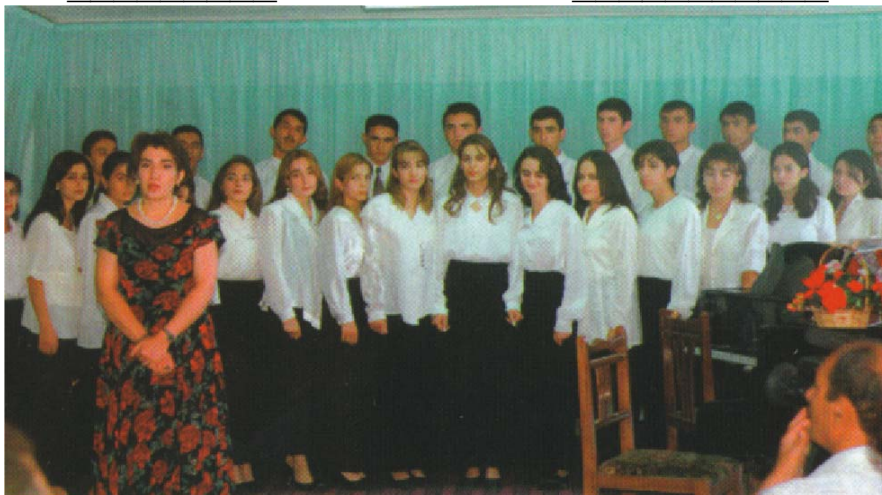
Texnikumda keçirilən tədbir, 2000-ci il