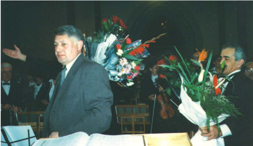
Nazim Quliyevin simfonik orkestrin ifasında «Nəqşi-cahan» konserti. 7 mart, 2003-cü il