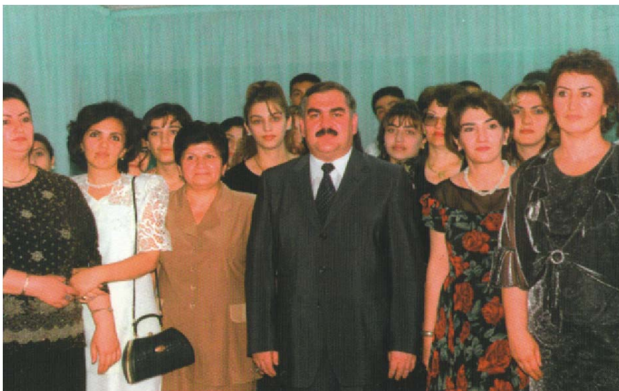
Naxçıvan Ali Məclisinin Sədri Vasif Talıbov Naxçıvan musiqi Texnikumunun kollektivi ilə birlikdə