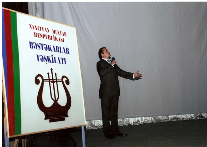
Naxçıvan Muxtar Respublikasının əməkdar artisti Tural Nəcəfov