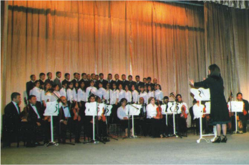
Naxçıvan musiqi Kollecinin birləşmiş xorunun üçüncü hesabat konsertindən çıxışı