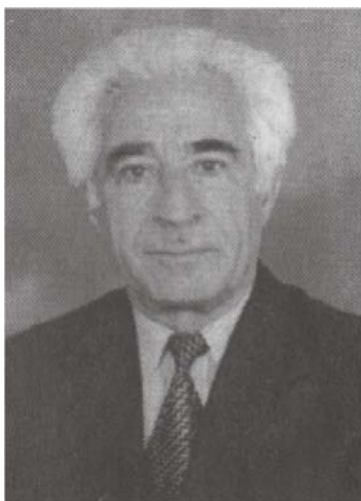
Azərbaycan Respublikasının əməkdar incəsənət xadimi, bəstəkar Rəşid Məmmədov

Məmməd Məmmədov musiqi mədəniyyətimizi mətbuat səhifələrində, radio və televiziya vasitələri ilə daima işıqlandırmış, məqalələri, çıxışları ilə həmişə musiqiçilərimizi yaradıcılıqla məşğul olmağa çağırmışdır.