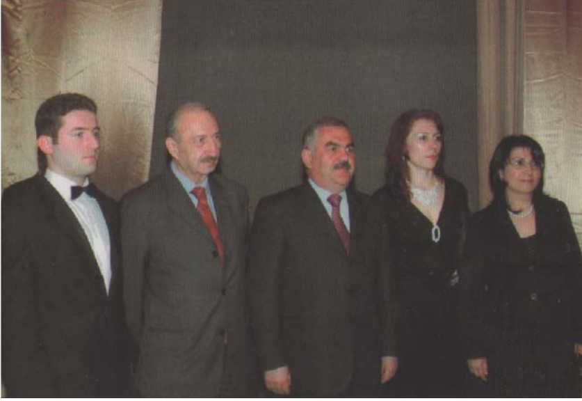
Naxçıvan MR Ali Məclisinin Sədri Vasif Talıbov Naxçıvan Bəstəkarlar təşkilatının III konfransının nümayəndələri ilə birlikdə.

Qeyd edək ki, Naxçıvan Bəstəkarlar Təşkilatının Azərbaycan Bəstəkarlar İttifaqının Bakıda keçirdiyi plenumlardakı çıxışları və Muxtar Respublikamızda ərsəyə gələn mədəni-kütləvi tədbirlərdəki iştirakı təşkilatın fəaliyyətinin genişlənməsini əks etdirir.