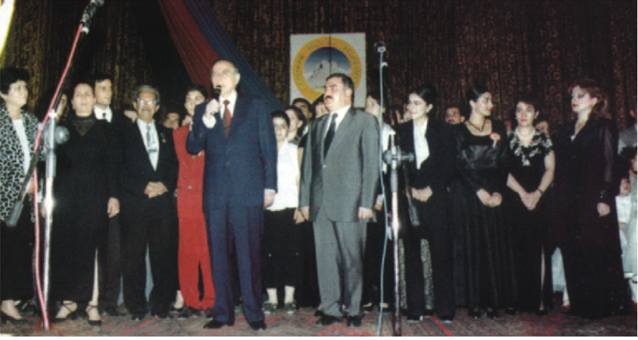
Naxçıvan Respublikasının 75-ci ildönümü ərəfəsində keçirilən konsertdən sonra Azərbaycan Respublikasının prezidenti Heydər Əliyevin Naxçıvan incəsənət ustaları ilə görüşü. 1999-cu il