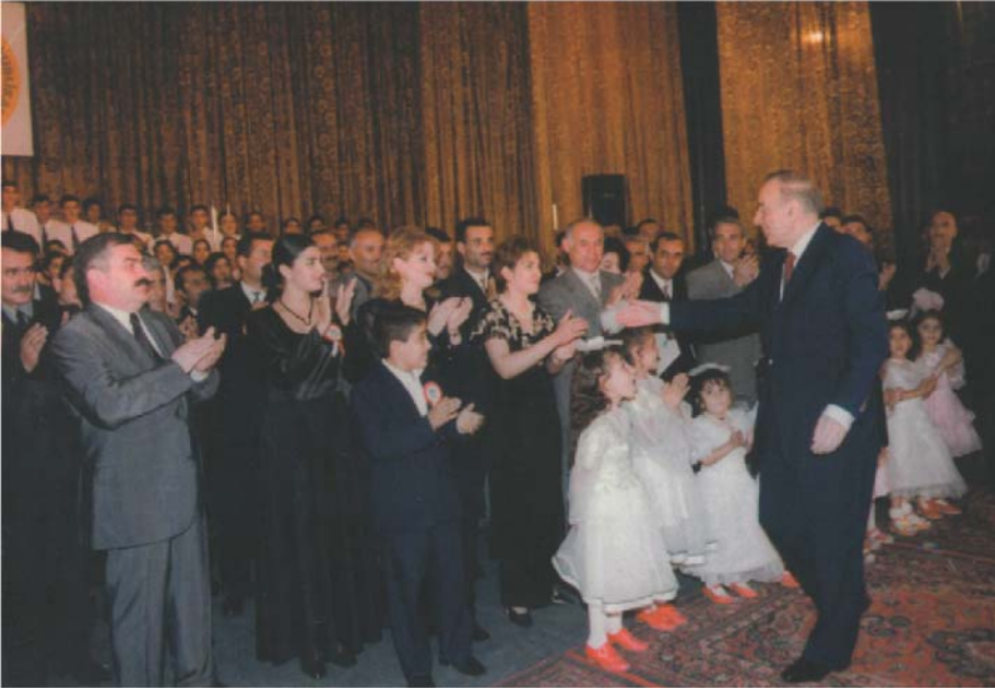
Heydər Əliyev Naxçıvan MR-nin 75 illiyinə həsr olunmuş konsertdən sonra Naxçıvan Musiqi Texnikumunda iştirak etdiyi musiqi