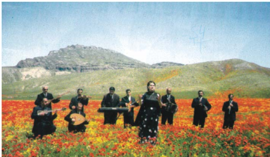
Naxçıvan Dövlət Filarmoniyasının «Gəmiqaya» instrumental ansamblı, 2002-ci il

Bütün bunların bariz nümunəsi kimi, zəmanəmizin böyük siyasi xadimi, ümummilli liderimiz Heydər Əliyevin 1999-cu ildə Naxçıvan Muxtar Respublikasının yaranmasının 75 illiyi münasibətilə keçirilən təntənəli gecədə naxçıvanlı sənətçilərinin istedadına, bacarığına yüksək qiymət verərək dediyi sözləri xatırlatmaq yerinə düşərdi: «Naxçıvanda mədəniyyət xeyli inkişaf edib, tərəqqi yoluna çıxıb. Bu torpağın istedadlı gəncləri çoxdur. Onlar Milli mədəniyyəti və milli ruhu gözəl qoruyurlar».